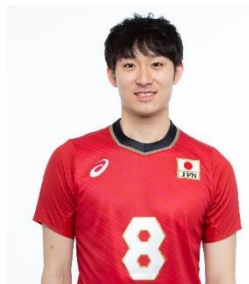
柳田将洋選手 (バレーボール)