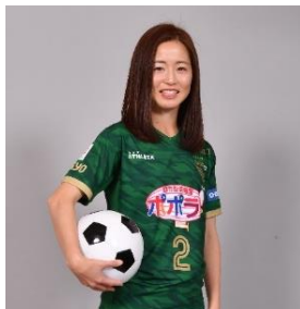
清水梨紗選手 (サッカー)

また、TV-CMに先駆けて6月27日(土)に掲載される新聞広告には、上記アスリートの方々に加え、同じくスポーツくじの理念にご賛同いただいたプロサッカー選手清水梨紗選手、バレーボール日本代表柳田将洋選手も登場します。