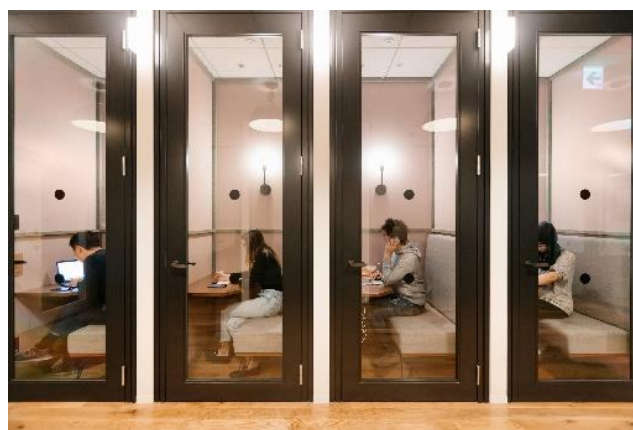
電話ブースもご利用いただけます。WEB会議にも安心してお使いいただけます。（写真：アークヒルズサウス）