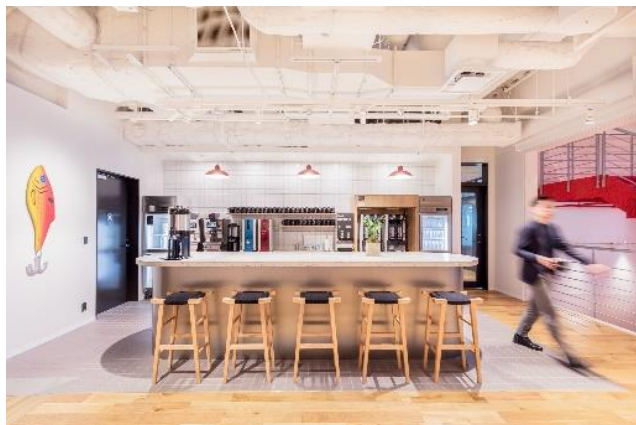
こだわりのコーヒーはもちろん、16時以降はビール*もフリードリンクとしてお楽しみいただけます。