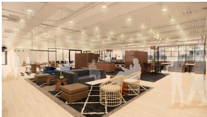
WeWork 日比谷 FORT TOWER イメージ