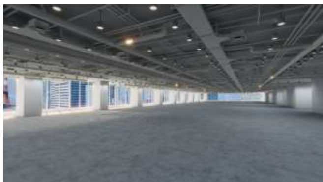
デザイン構築前のスペース

コロナ禍により、オンライン会議による商談の場が劇的に増え、実際に WeWork 拠点を訪れることなく、バーチャルツアー（オンライン）でオフィスを体験したいという需要が高まっています。また、提案段階においては、営業とプロダクトデザインチームが協業してお客様の要望に応じたカスタマイズ設計を構築し、リアルな場で提案していました。今後、BeyondView のテクノロジーを活用することにより、レイアウトのデザインやカスタマイズ案を迅速かつスムーズに構築して、お客様に提案することが可能になります。営業とプロダクトデザインチームの業務を効率化して、お客様の入居前から入居後までのカスタマーエクスペリエンスの向上にも寄与します。また、提案から決定までのプロセスに最新のテクノロジーを活用してデジタル化（DX）を図り、新たな商談モデルを確立します。