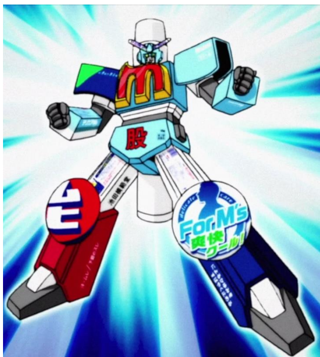
アニメ動画版「股間戦士エムズーン」

「股間戦士エムズーン」のVTuberデビューは、肌のトラブルの分野などでも事業展開する同社のスローガン「変身への挑戦」をスタートさせた日である6月1日の「ムヒの日」に、日本中のかゆみをなくしたいという思いから決定いたしました。この股間戦士エムズーンのVTuber化は、昨年より公開されている第3話までの累計視聴回数450万回以上の再生回数を記録したアニメの映像から飛び出しVTuberに変身いたします。2019年の夏の股間平和を守るために、VTuberとしての活躍だけでなく、大人気アニメシリーズ「股間戦士エムズーン」の続編も、この夏に公開を予定しております。