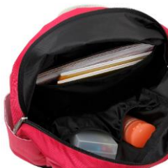
たくさんのポケットで、 すっきり整理整頓

通学用として使うバッグは、スタイルの好みはもちろん、各自、荷物の量などによってさまざまです。バックパックタイプでは約30L容量の「C-ビッグパック」、約25L容量の「C-デイパック」、約15L容量の「C-ミニパック」を。ほかにも着脱可能なショルダーベルト付きでA4サイズの収納がOKな「C-デイダッフル」、「C-デイトート」と、用途に合わせてタイプを選べます。いずれもレザーボトムを採用しており、地面に置いても自立。また深めのサイドポケットには保冷性と防水性を併せ持つ COOL POCKET が付き、ペットボトルや濡れた傘もそのまましまえます。優れたデザインと便利な機能がさりげなく融合した作りです。