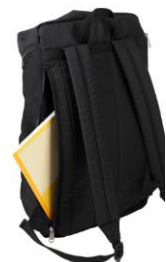
ビッグパックには メインにアクセスできるジッパー付