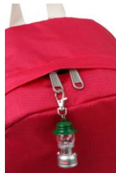
大き目ジッパーでカスタマイズ自由！