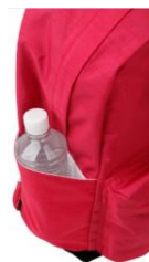
便利な COOL PKET 付