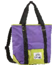
GRP (グリーン/パープル)