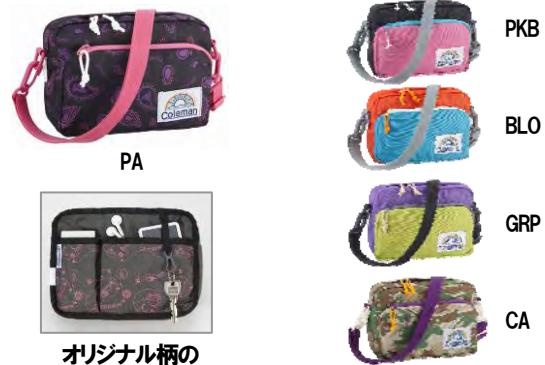
オリジナル柄の 仕切りポケット