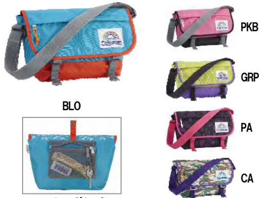
メッシュポケット (キーフック付き)