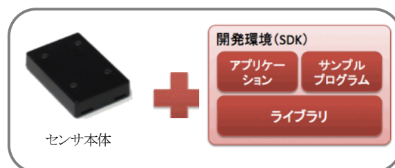
e-nuvo IMU-Z2 基本パッケージ