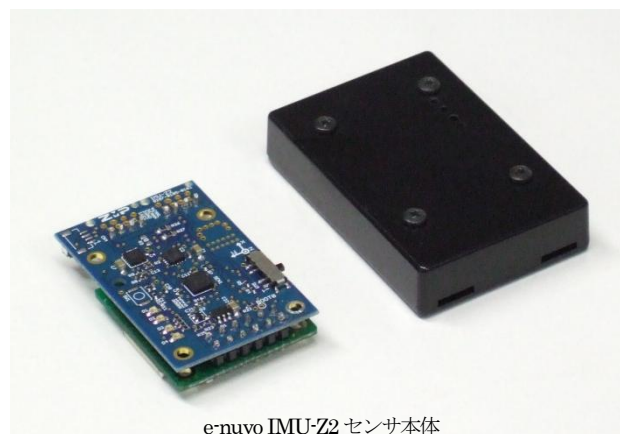
e-nuvo IMU-Z2 センサ本体