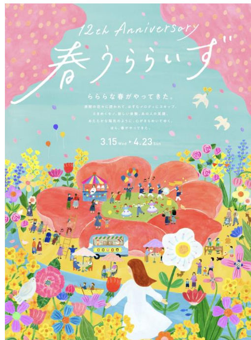
12th Anniversary「春うららいず」キービジュアル

キャンペーン後半を彩るスペシャルコンテンツとして、花をテーマにした2種類の体験型イベントを実施します。オリジナルノベルティや二子玉川ライズ S.C.で使えるお食事・お買物券がもらえるチャンスです。