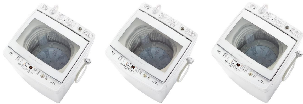
AQUA 全自動洗濯機 AQW-GV90H／AQW-GV80H／AQW-GV70H (洗濯・脱水容量:9kg／8kg／7kg)