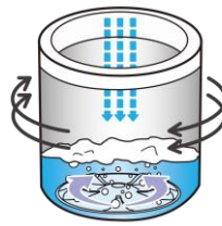
洗濯槽を回転させ 衣類全体へ 水を浸透