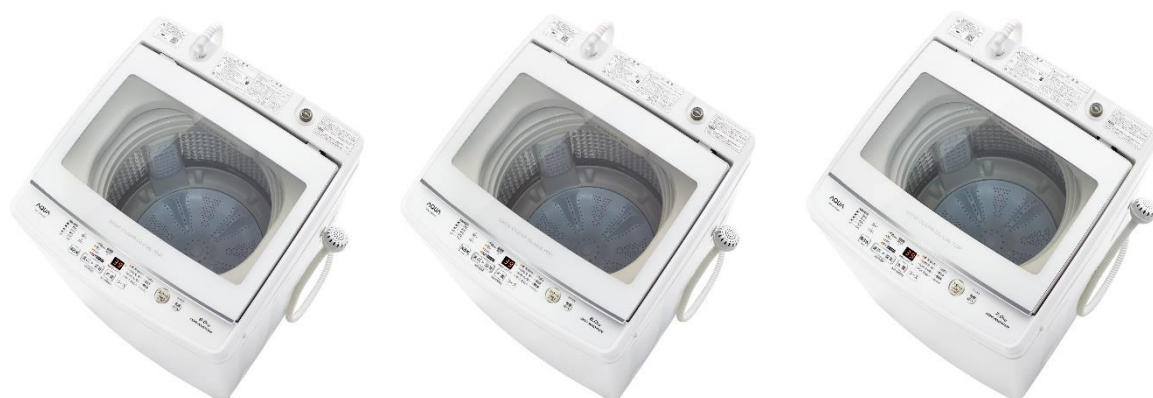
AQUA 全自動洗濯機 AQW-GV90H/AQW-GV80H/AQW-GV70H (洗濯・脱水容量: 9kg/8kg/7kg)