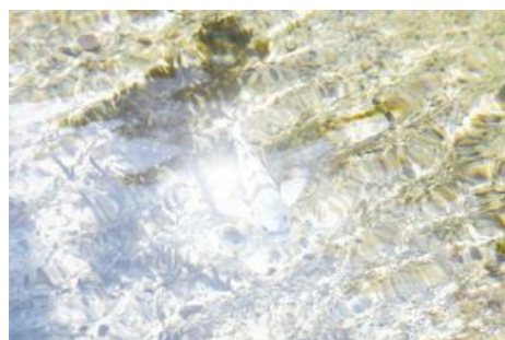
偏光サングラスなし