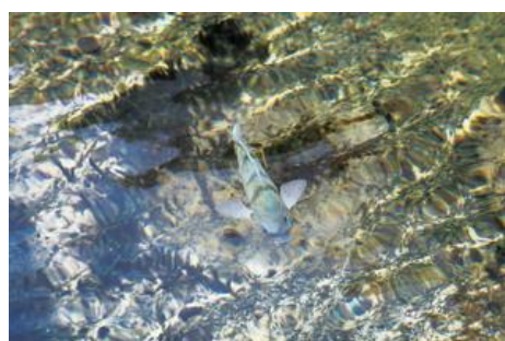
偏光サングラス着用時

こめかみ部分には、ブルータルの名にふさわしいデザインでベンチレーション機能を搭載。シリコン製パーツは脱着可能であり、装着時は花粉やホコリの侵入を防ぎます。フロントリムの上下にシェードを設けており、眩しさや紫外線、花粉などを防ぐ構造になっています。また、無意識に下向きで置いてしまっても、レンズ面に傷がつきにくいようデザインされています。