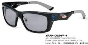
SR-019P-1 JAN: 4208800009480 CI: 0031000001 Frame: パールブラック×ブルー・レッドエンブレム Lens: テンダーグレー (可視光線透過率37%・偏光度99%)

STORMRIDER TRUTH SR-019P Size: 49(2)×11.5×148(4)-71