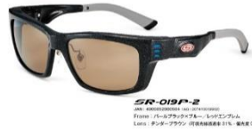
SR-019P-2 JAN: 4208800009480 CI: 0031000002 Frame: パールブラック×ブルー・レッドエンブレム Lens: テンダーブラウン (可視光線透過率31%・偏光度99%)

STORMRIDER TRUTH SR-019P Size: 49(2)×11.5×148(4)-71