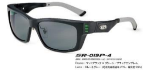
SR-019P-4 JAN: 4208800009480 CI: 0031000004 Frame: マットブラック×グリーン・ブラックエンブレム Lens: スレートグレー (可視光線透過率20%・偏光度99%)

STORMRIDER TRUTH SR-019P Size: 49(2)×11.5×148(4)-71