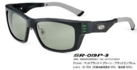
SR-019P-3 JAN: 4208800009480 CI: 0031000003 Frame: マットブラック×グリーン・ブラックエンブレム Lens: G-15A (可視光線透過率29%・偏光度99%)

STORMRIDER TRUTH SR-019P Size: 49(2)×11.5×148(4)-71