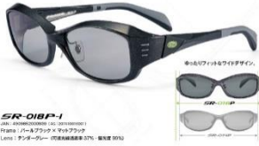
SR-018P-1 JAN: 4208800009480 CI: 0031000001 Frame: パールブラック×マットブラック Lens: テンダーグレー (可視光線透過率37%・偏光度99%)

STORMRIDER リラックスワイド2 RELUX WIDE-2 SR-018P Size: 49(2)×10.5×148(4)-71