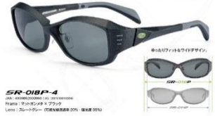
SR-018P-4 JAN: 4208800009480 CI: 0031000004 Frame: マットガンメタ×ブラック Lens: スレートグレー (可視光線透過率20%・偏光度99%)

STORMRIDER リラックスワイド2 RELUX WIDE-2 SR-018P Size: 49(2)×10.5×148(4)-71