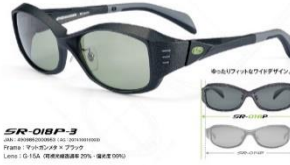
SR-018P-3 JAN: 4208800009480 CI: 0031000003 Frame: マットガンメタ×ブラック Lens: G-15A (可視光線透過率29%・偏光度99%)

STORMRIDER リラックスワイド2 RELUX WIDE-2 SR-018P Size: 49(2)×10.5×148(4)-71