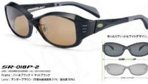
SR-018P-2 JAN: 4208800009480 CI: 0031000002 Frame: パールブラック×マットブラック Lens: テンダーブラウン (可視光線透過率31%・偏光度99%)

STORMRIDER リラックスワイド2 RELUX WIDE-2 SR-018P Size: 49(2)×10.5×148(4)-71