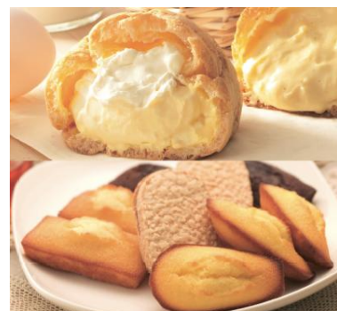
上:ダブルシュークリーム 下:焼き菓子