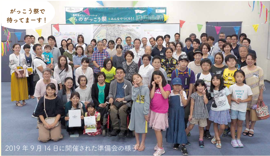
2019年9月14日に開催された準備会の様子

『南町田グランベリーパークまちのがっこう祭』は、2016年度から「南町田拠点創出まちづくりプロジェクト」の一環で開催している市民ワークショップから生まれた、新しいまちへのワクワク感を共有するイベントです。