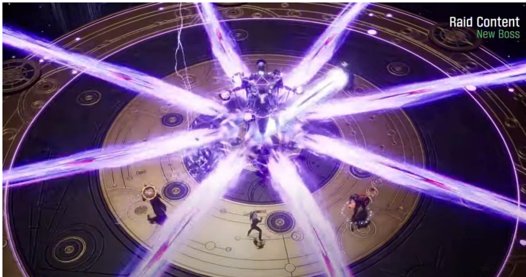
<最大8人のユーザーが参加できる新規レイド「カスポルノ大魔法師」>

めの投資ポイントの制限をあげるのに使用でき、キャラクターをより強力に成長させることができる道具として使われます。