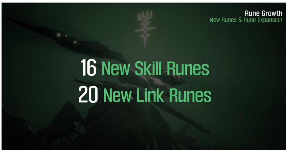
<大規模アップデートで新規ルーン36種が追加>

: 「カオスダンジョン」の難易度が上昇し報酬が拡大されます。新しい「権能効果」を付与できる「権能ボス」と新規カオスダンジョンイベント要素が追加となります。