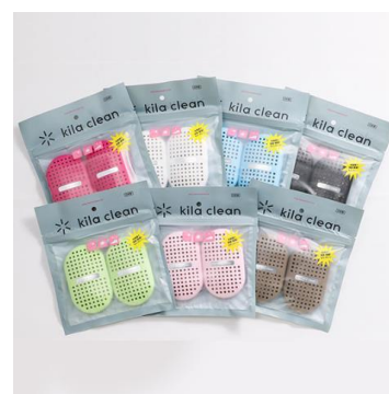
キラ・クリーン 消臭除菌剤（靴等用）