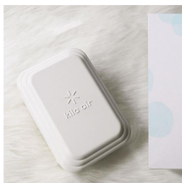
キラ・エア 小型消臭除菌器（靴箱等用）