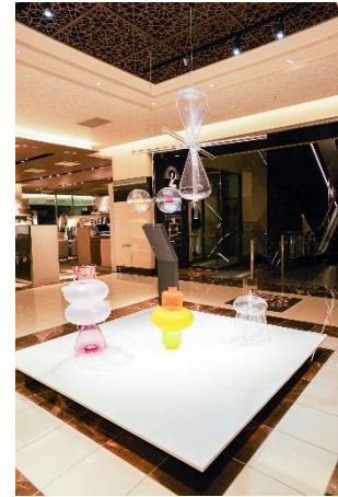
本館2F “Floating Futures”