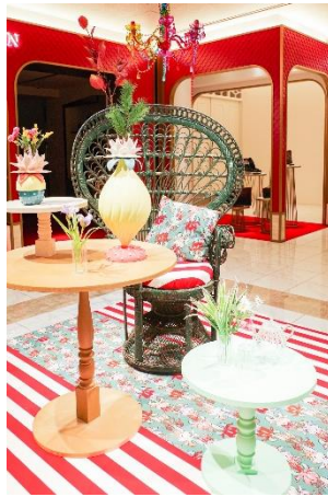
本館3F “B-Loom – La Tavola Scomposta Collection”