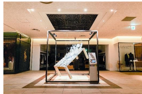
本館5F “mt CASA”