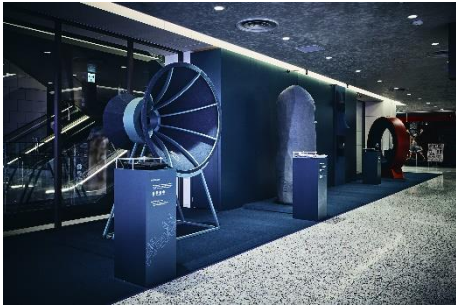
本館9F “Isko Denim Sound Textures”