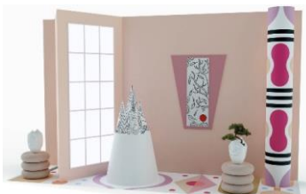
Tokonoma Primates window