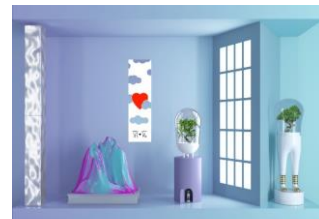
Tokonoma Domsai window