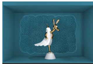
Yokai Splendor window