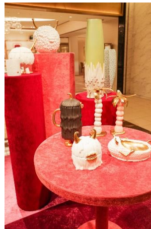
本館2F “L’Objet + Haas Brothers”