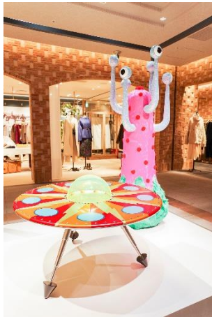
本館4F “A Space Oddity”