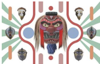
Yokai Primates window