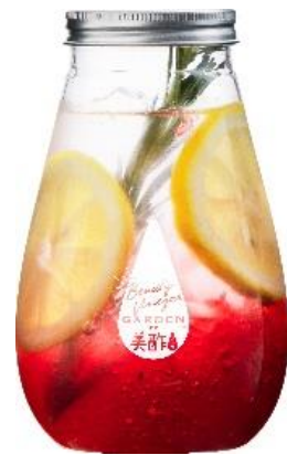
提供ボトルデザイン

コストコで1ヶ月に35万本以上売れた大ヒット商品である「美酢」は、100%果実発酵のお酢から作った果実の美味しさを楽しむ韓国生まれのビネガードリンクで、6月17日(月)からは松井愛莉さん出演のCMも放映されています。