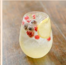
美酢フルーツアーピーチ