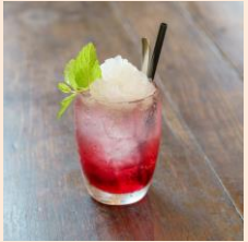
フローズン 美酢ざくろサワーレモネード