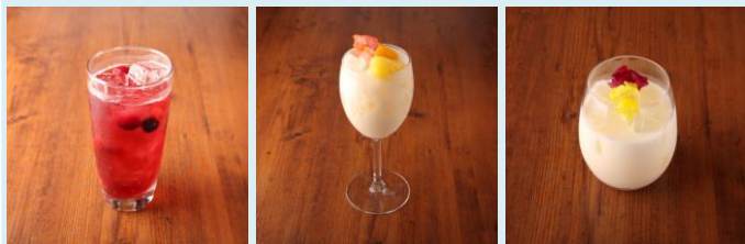
美酢ざくろクーラー 美酢バージンピニャコラーダ 美酢ピーチエ