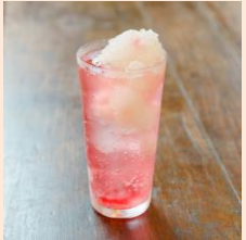
フローズン美酢ざくろサワー