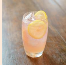
ピンク美酢 ピーチスカッシュ