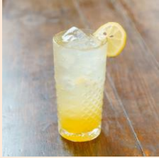
美酢パインソーダ