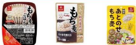
もち麦ごはん 無菌パック 国産かけるだけもち麦 あとのせもち麦