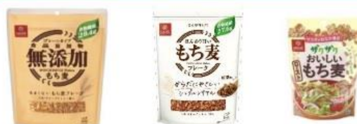
あまくないもち麦フレーク ほんのり甘いもち麦フレーク 黒糖味 ザクザクおいしいローストもち麦