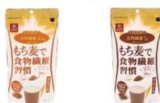
もち麦で食物繊維習慣 きなこ味/カカオ味