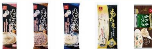
もち麦うどん もち麦そば もち麦そうめん もち麦手もみ風うどん もち麦パスタ