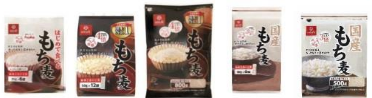
はじめて食べるもち麦 もち麦 スタンドパック もち麦 800g 国産もち麦 スタンドパック 国産もち麦 500g