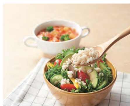
大麦には水溶性食物繊維がたっぷり