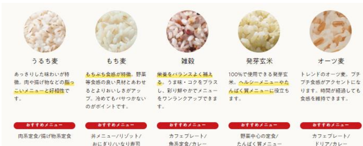
図：選べるごはんのご紹介

コロナ禍をきっかけに生活者の健康への意識は大きく変化しています。健康は意識しつつも、食生活が乱れがちな現代社会において、自分のカラダを正常で健康な状態にキープしたいというニーズは高まっており、今後も拡大していくと考えられます。内側からのカラダづくりを通じて、健康な状態にととのえたいという、生活者のニーズにこたえるのが、ごはんを選べる「ととのう食べ方」という選択です。