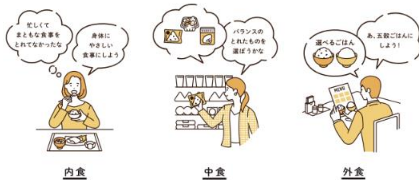
“ごはんの選べるお店”に魅力を感じますか