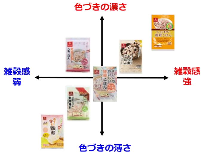
●はくばく雑穀商品のポジショニングマップ