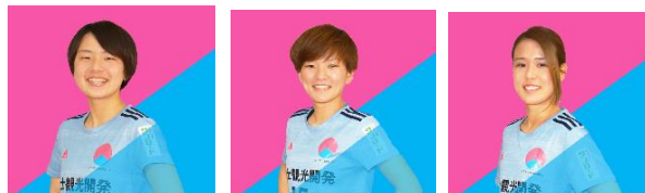
中心になって活動いただくFCふじざくら山梨選手