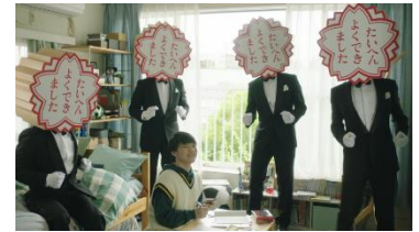
オンライン個別指導塾「そら塾」