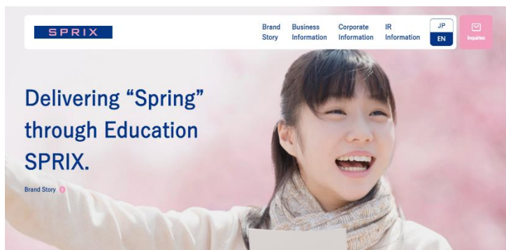
新コーポレートウェブサイト英語版