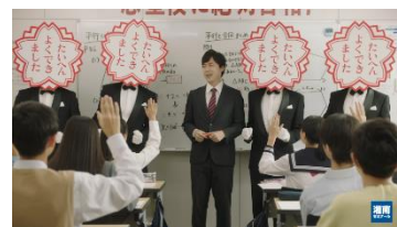
集団学習塾「湘南ゼミナール」

「たいへんよくできました」スタンプが、学習している生徒を取り囲み、やる気やモチベーションを効果的に引き出している様子がスプリックスのビジョンを表現しています。また、生徒自身が真剣に、楽しく学習に取り組む姿勢も、スプリックスならではの光景です。