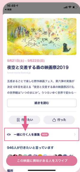
行きたいイベントや映画を Twitterへ募集