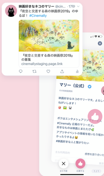
アプリで応募が来るのを待つ ※ 48時間で応募は解除されます