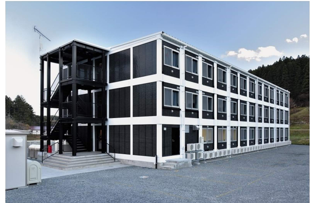
▲アイルーム南三陸

アズ企画設計は、東日本大震災で被災した地域の復興のため、復興事業を行う作業員の宿泊施設が広範囲にわたって不足している中、宿泊施設の建設が復興作業を加速させると判断し、2015年12月、宮城県本吉郡南三陸町に復興事業を行う作業員向けの宿泊施設「アイルーム南三陸」を建設し、ホテル事業を展開してきました。本宿泊施設は、在来工法と比べて大幅に工期を短縮することが可能なモジュール工法を採用し短い工期で建設した一方で、ゆがみにも強い重量鉄骨を採用