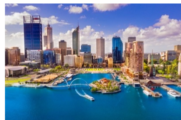
西オーストラリア州の州都「パース」

路線： 成田＝パース 運航再開日： 10月29日(日) ダイヤ： NH881 成田 11:20 ⇒ パース 20:30 NH882 パース 21:55 ⇒ 成田 08:30(翌日) 運行便数： 3往復/週 運行日： 水・金・日