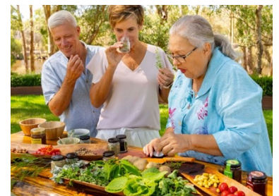
ブッシュタッカー トーク&テイステイング