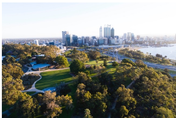
「キングスパーク」からのパースの眺め