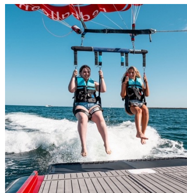
パラセーリングでホエールウォッチング

いよいよ10月29日(日)より、成田から西オーストラリア州の州都「パース」へ、ANAの直行便が週3往復(水・金・日)で運航を再開します。日本と季節が逆の西オーストラリア州は、現在、陽光あふれる春たけなわ、観光に最適なシーズンを迎えています。「パース」から気軽に行ける人気の港町「フリーマントル」では11月3日(金)から17日間にわたり国際芸術祭「フリーマントル・ビエンナーレ」が、ビーチリゾート地「ロッキンハム」では11月11日(土)・12日(日)にユニークな競馬イベント「ロッキンハム・ビーチカップ」が開催されます。また、新しいアクティビティも多数登場し、「パース」を拠点に夢のような旅が楽しめます。