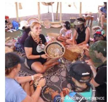
カルチャー・ウィーブ