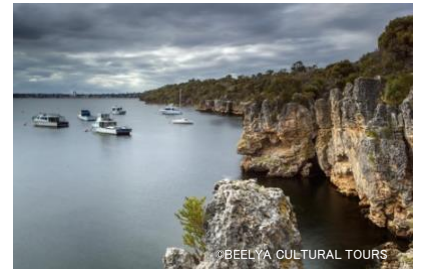
ビーリヤ・カルチュラル・ツアーが提供する スワン川クルーズツアー

先住民ヌガー族には、植物や動物の兆候、環境の変化に基づいた6つの季節があり、このツアーではそれぞれの季節でウォーキングツアーを開催しています。季節ごとに見ることができる様々な動植物について学びながら、世界最古の文化に触れることができます。また、7月11日にはスワン川を巡る約3時間のクルーズツアーが開催されます。アボリジナルの伝統的なブッシュフードを使ったビュッフェを楽しみながら、ドリームタイムの神話、川の豊かな生態系、季節ごとの食材や、植物を薬草にする伝統的な方法、さらにはサバイバル技術のレクチャーもあり、アボリジナル文化の知見を深める貴重な機会を提供しています。