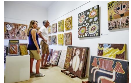
ワリンガリ・アボリジナル・アーツ