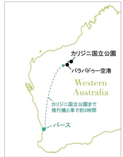
パースからカリジニ国立公園までのアクセス

https://events.humanitix.com/dining-experience-2025