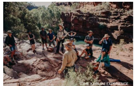
BHP・バンジマ・ツアード・ウォーク