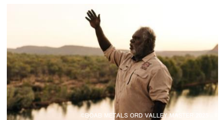
先住民ンガリニン族のガイドが案内するエル・クエストロ・カルチュラル・フルディツアー