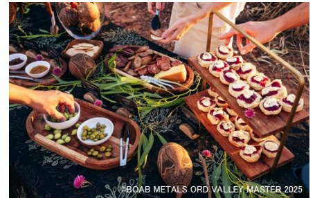
アート・カルチャー&クイジーンで提供される食事

「エル・クエストロ・ステーション」の伝統的所有者である先住民ンガリニン(Ngarinyin)族のガイドによる特別な文化体験ツアー。「カナナラ」からスタートし、チェンパレン川でのクルーズの後は、ブッシュタッカーにインスパイアされたランチを楽しみ、さらに「エル・クエストロ」の探究ツアーへ。古代の癒しの儀式を体験し、代々伝わる物語を聞き、歴史と先祖伝来の遺産について学ぶことができます。