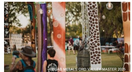
アート・イン・ザ・パークのギャラリー