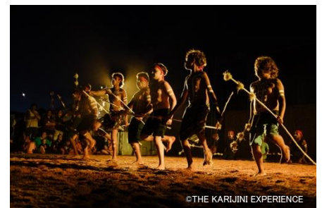
ウェルカム・トゥ・カントリー&バルガビ