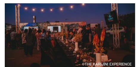
ダイニング・エクスペリエンス・ウィズ・ザ・ストーリーテラー・シェフ