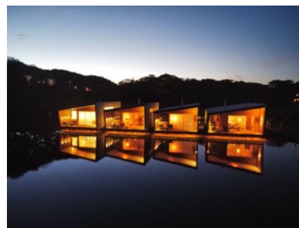
エッジ・ラグジュアリー・ヴィラ