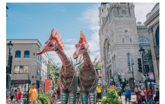
写真: フリーマントル・インターナショナル・ストリート・アート・フェスティバル

URL: https://www.streetartsfestival.com.au/