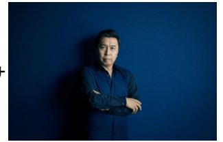
ジャズピアニスト 小曾根 真氏