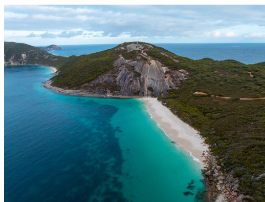
「アルバニー」の景観

2026年、西オーストラリア州では、スポーツやカルチャーなど数多くの大型イベントが年間を通じて展開されます。多彩なイベントの中から、壮大な自然景観、文化遺産、美食、革新的なアートなどを体感できる、旅行者におすすめのカルチャーイベントをご紹介します。特に注目を集めるのが、「 アルバニー 2026 」です。2026年は、南部の歴史ある街「アルバニー」のはじまりから200周年を迎える節目の年となり、自然・食・アートを横断するイベントが「アルバニー」で1年を通じて大々的に開催されます。また、プレミアムなフード&ワインの祭典「テイスト・グレート・サザン」や、美しい白砂のビーチを舞台にしたアートエキシビジョン、州都「パース」でのアート&カルチャーの祭典、人気観光地「フリーマントル」での大道芸フェスティバルなど、旅行者が楽しめる魅力的なイベントが目白押しです。