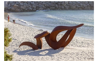
2024 年開催時の受賞作品 写真: スカルプチャー・バイ・ザ・シー HP

URL: https://sculpturebythesea.com/cottesloe/