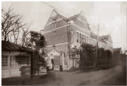
▲女子教育に携わり、校長も務めた日本女子大学校