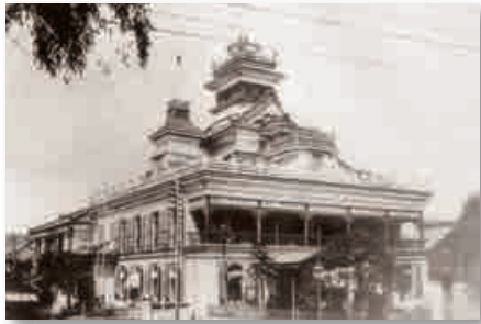
▲栄一が設立に関わった第一国立銀行

渋沢栄一翁について http://www.shibusawa.or.jp/ (公益財団法人渋沢栄一記念財団URL)