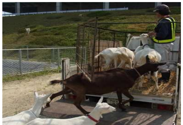
エコ除草のお仕事を終え、帰途に付くヤギ達。 社員達から「お疲れ様です！また来てね。」の声が響き渡りました。

※画像提供をご希望の方は、株式会社ブラップジャパン(03-4580-9103)までお問い合わせください。