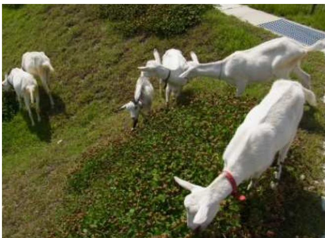
約 10 頭のヤギ達は、むしやむしやと夢中で草を食み続けます。