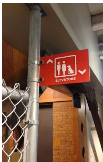
エレベーターにもペットの犬と共に乗ることができます。