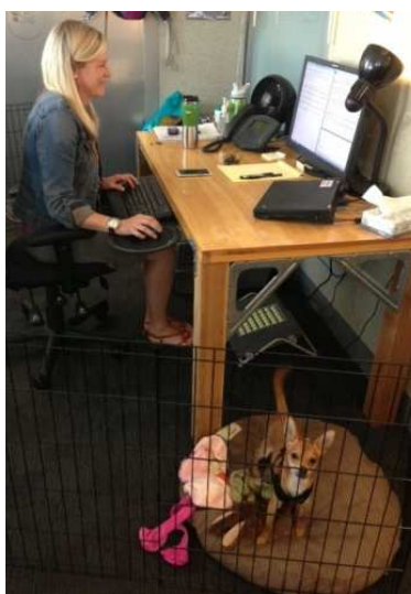
デスクの間近にペットの犬がいる様子。