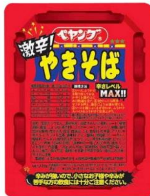
ペヤング 激辛やきそば 118g×18 個 3,300 円