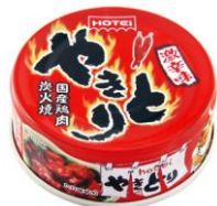
ホテイ やきとり激辛味 80g×6 個 835 円