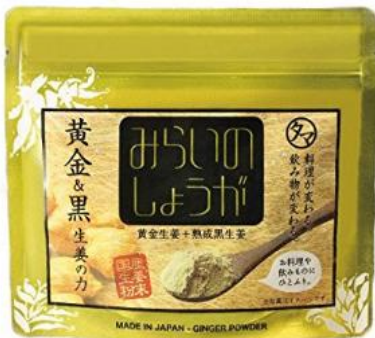
黄金しょうが粉末 九州産黄金&熟成黒しょうが粉末 (生姜粉末) 70g 1,501円