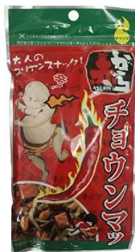
アジル 赤からチョウンマツイリこ入り 50g×3 個 875 円