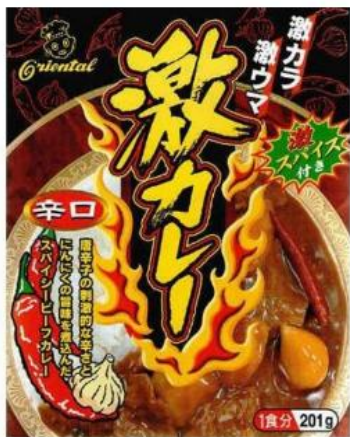
オリエンタル 激カレー 201g×5 個 1,375 円

カップラーメン 1 個、ハブラシ 1 本など食品・日用品をひとつから選べ、専用のパントリーBox にてまとめてお届けする Amazon プライム会員向けサービス「Amazon パントリー」にて、期間限定で激辛グルメの特集をオープンいたしました。(特集ページ URL: https://www.amazon.co.jp/b?node=4709624051 ) 辛いもの好きにはたまらない、なかなか手に入らない激辛グルメも発見できるかも!?