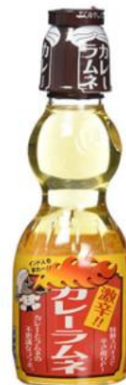
木村飲料 激辛カレーラムネ 160ml×30 本 4,860 円