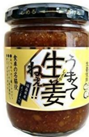
【国産生姜使用】 うまくて生姜ねえ!! 240g 930円