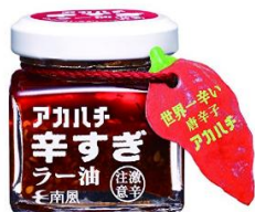
サウスプロダクト アカハチ 辛すぎラー油 35g 1,000 円