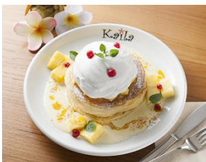
<トロピカルパンケーキ>