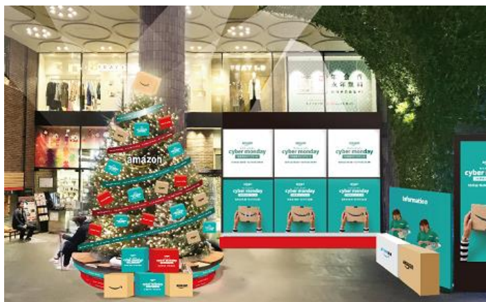
<Amazon Holiday 2017 ポップアップストア イメージ>

本ポップアップストアは、Amazon のタイムセール商品を実際に見られ、サイバーマンデーセールをリアルタイムで体験できる初のポップアップストアイベントです。サイバーマンデーセールのおすすめ商品を展示し、QR コードをスマートフォンなどで読み取ることによって Amazon の商品詳細ページにアクセスして、その場でタイムセールの商品を注文できます。また、Amazon Fashion の紹介、Amazon Echo シリーズのタッチ&トライコーナー、Amazon アプリストアの人気ゲームイベントや新作ゲームの試遊などのイベントコーナーを設置します。そして Amazon プライムのサービスである「Prime Now」のサイバーマンデーセール対象商品の受け取りや、カフェでの「Amazon フレッシュ」の期間限定メニュー提供を実施します。さらに、Amazon のカスタマーサービススタッフが、Amazon プライムの説明を初めて対面でご案内します。