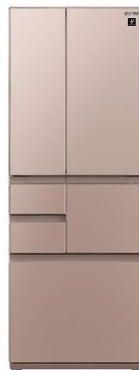
シャープ メガフリーザー 冷蔵庫 502L