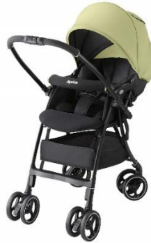
Aprica 軽量オート4輪ベビーカー ラクーナエア