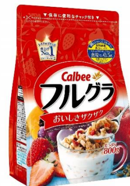
カルビー フルグラ 800g × 6袋