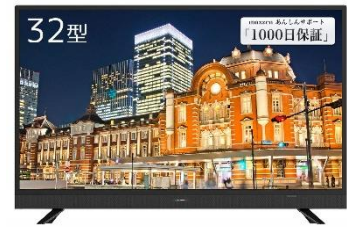
maxzen J32SK03 32V型