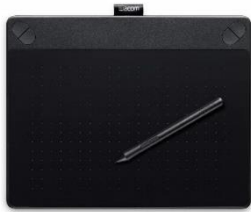
ワコム Intuos Comic【旧モデル】 ペン&タッチ マンガ・イラスト制作用モデル