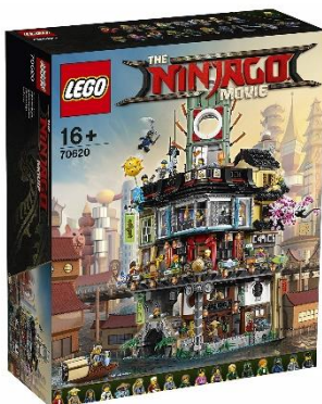
LEGO ニンジャゴー シティ