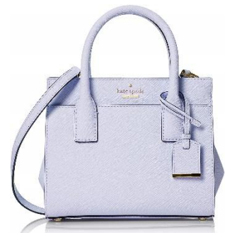
ケイト・スペード 2WAY バッグ レディース