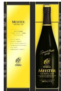
【Amazon.co.jp 限定】[エビスの最高峰] エビス マイスター ザ・ロイヤルリーフ スペシャルボトル 750ml