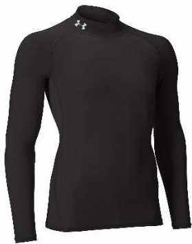
アンダーアーマー ヒートギアアーマー コンプレッションLS モック