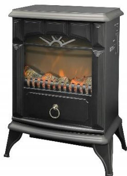
山善 暖炉型ヒーター