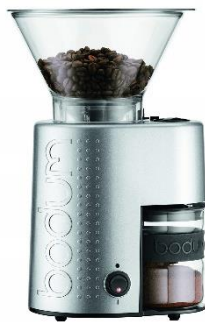
BODUM BISTRO 電動コーヒーミル