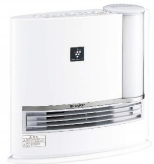
シャープ プラズマクラスター搭載 加温セラミックファンヒーター