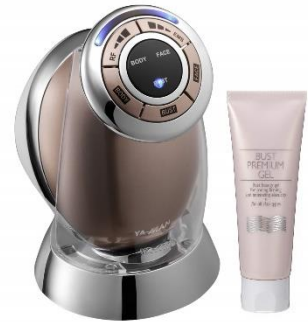
YA-MAN 家庭用 キャビテーション バストプレミアムゲルセット