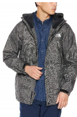
ザ・ノース・フェイス リアビュー フルジップフーディ