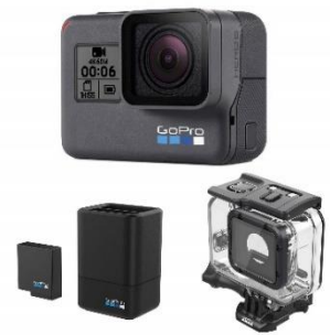
GoPro HERO6 Black + デュアルバッテリー チャージャー + Super Suit 3点セット