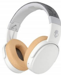
Skullcandy Crusher Wireless