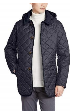
ラベンハム キルティングフード付きコート