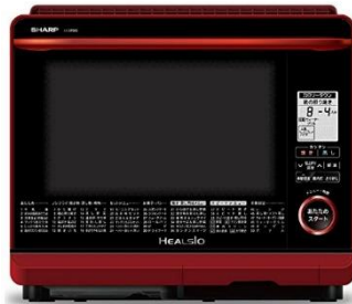
シャープ ウォーターオープン ヘルシオ