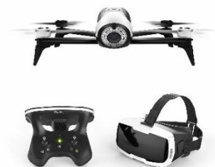
Parrot ドローン Bebop 2 + Skycontroller2 + FPV ゴーグル FPV セット