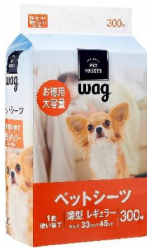
【Amazonブランド】Wag ペットシート 薄型 レギュラー 1回使い捨て 300枚