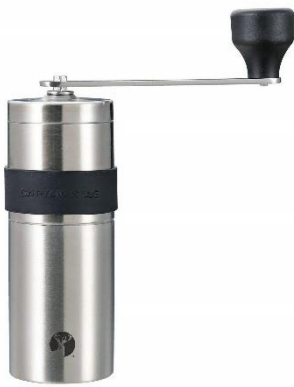
パール金属 キャプテンスタッグ コーヒーミル