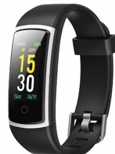
GanRiver スマートウォッチ

※商品は都合により変更になる可能性があります。 ※各商品の最新価格は、Amazon.co.jpサイトをご参照ください。