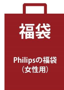
[おまかせ福袋] Philips 2019 年福袋 3点セット(女性用)