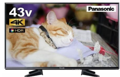
パナソニック 43V型 液晶 テレビ VIERA