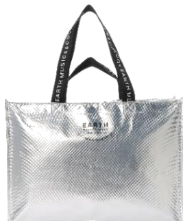
アースミュージックアンドエコロジーやフレイ アイディーなどのブランド福袋を多数ご用意