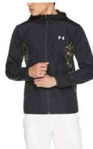
アンダーアーマー 9 ストロング ウーブンジャケット