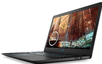
Dell ゲーミングノートパソコン G3