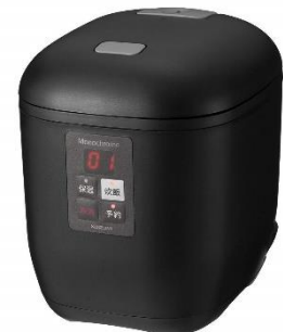
コジツミ 小型炊飯器 ライスクッカーミニ (0.5~1.5合)