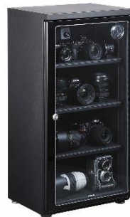
[Amazon.co.jp 限定] HAKUBA 電子防湿庫 Eドライブボックス 128リットル