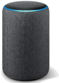
Echo Plus 第2世代 (Newモデル)