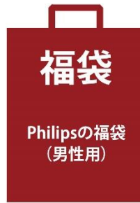
[おまかせ福袋] Philips 2019 年福袋 3点セット(男性用)