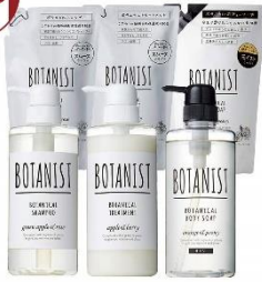
[見える福袋] BOTANIST 福袋 2019 6点セット<スムースセット>