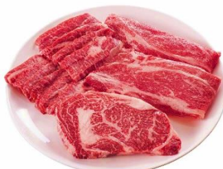
[冷凍] 氷室熟成 北海道産十勝黒牛 食べ比べ3種セット