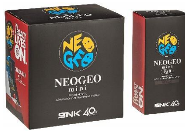
NEOGEO mini + NEOGEO mini PAD (黒) セット