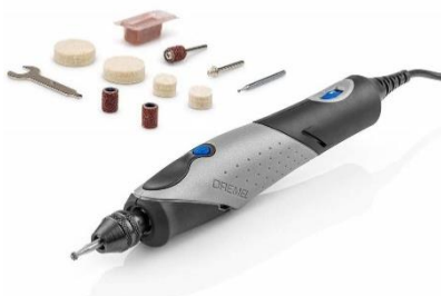
Dremel ペン型ミニルーター FINO