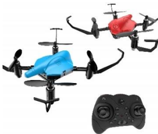
Holy Stone 対戦型ドローンセット 子供用ドローン