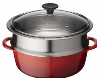
【見える福袋】ルクルーゼ ココット ロンドファースト スチーマーセット (数量限定販売)