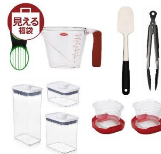
【見える福袋】【2019年 福袋】オクソー定番キッチンツール 6点セット