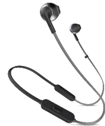
JBL TUNE205BT Bluetooth イヤホン