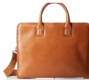
デュモンクス ブリーフケース