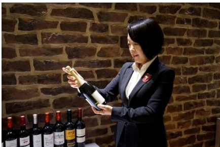
Amazon ソムリエ(イメージ)

普段は Amazon.co.jp サイトのワインページ経由でお客様からのお問い合わせに E メールや電話で対応している Amazon ソムリエが、今回は特別に Amazon Bar へ出張。ワインについては、オーダーシステムで注文する代わりに、Amazon ソムリエに直接相談してワインを選ぶことも可能です。「Amazon ソムリエ」サービスを店舗で直接体験できる機会をご提供します。