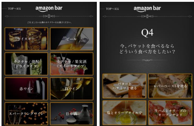
オーダーシステム(イメージ)

Amazon Barは『メニューがない Bar』として、お客様がこれまで飲んだことのないお酒との出会いの機会をご提供できるよう、その日の気分に応じたお酒をおすすめするユニークなオーダーシステムをご用意しています。注文用端末で8種のお酒の 카테고리から好みのものを選択していただき、その後“今の気分”についてのいくつかの質問にご回答いただくと、その時の気分にあった商品がおすすめされ、その商品を選択すると注文が完了するシステムです。 ※おすすめされる商品は1種類ではなく、複数候補が表示されます。