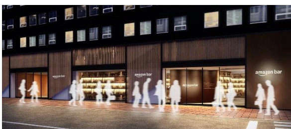
「Amazon Bar」外観 (イメージ)

<Amazon Bar 特設ページ: https://www.amazon.co.jp/amazonbar >