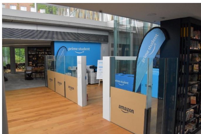
<Prime Student Room 外観>