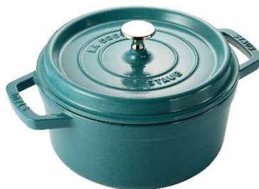
ストウブ 【Amazon.co.jp 限定】ココット ラウンド ミント