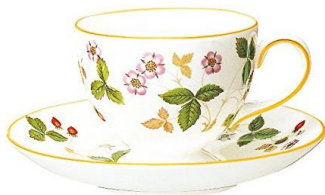
ウェッジウッド ワイルド ストロベリー カップ&ソーサー