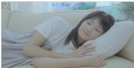
ウナコーラ虫よけ当番