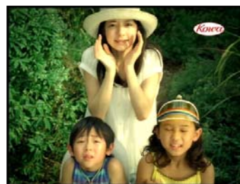
新ウナコーラクール「もろこしヘッド」