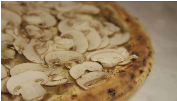
看板メニューのピザは、旨味たっぷりの仕上がり。

ピザ生地とフォカッチャは、低温でじっくり発酵させた高加水生地。外は軽く、中はもっちりとした食感で、具材を引き立てながらも、小麦の味わいをしっかり感じられます。