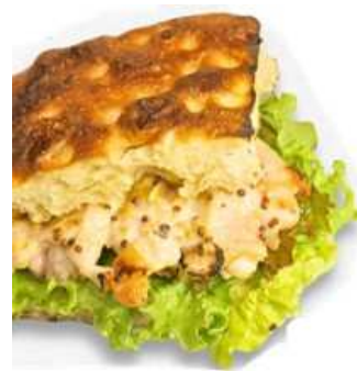
フォカッチャも店内で焼き上げる。