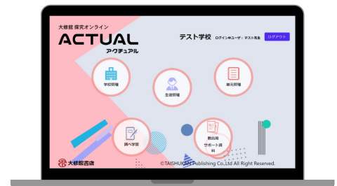
アクチュアルトップ画面

大修館書店 教科書・教材サイト「探究活動」： https://www.taishukan.co.jp/tankyu/