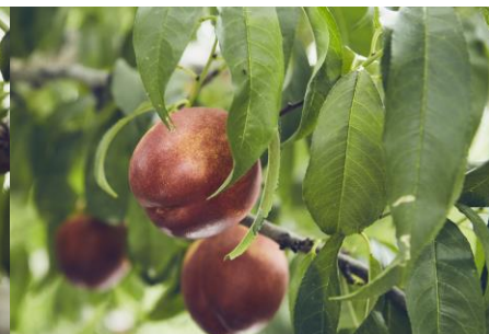
桃、『貴陽』、『ネクタリン』