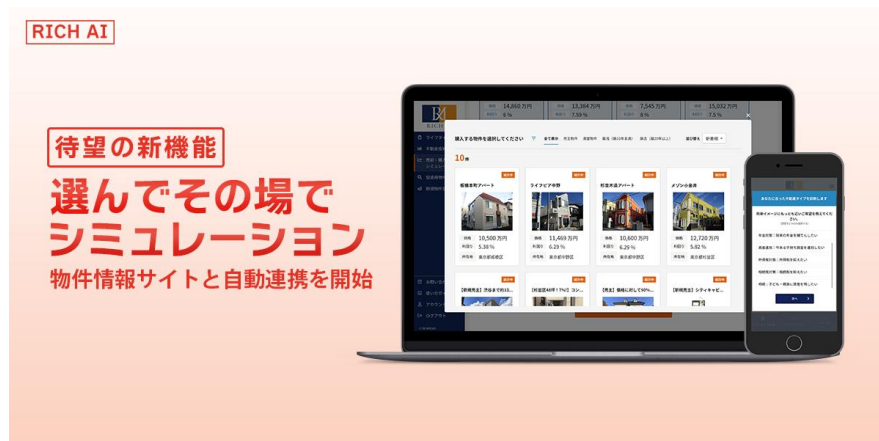
※サービス画像① リッチA I

「リッチA I」は、不動産投資専門会社として20年以上の経験を持つリッチロードのノウハウとリーウェイズの2億件を超える不動産ビッグデータを活用した Gate. API を組み合わせ、直感的なグラフとA Iデータを通じて「見える」不動産投資をサポートする無料のサービスサイトです。