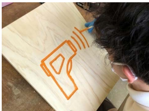
学生の手描きで作成

今回の什器は複雑な形にも対応できるよう、強度のあるヒノキを使用し制作しました。ヒノキを使用したことで斜めの形にも組み立てることができました。組み立て式のため、簡単に什器を分解することができ運搬に適したものとなりました。