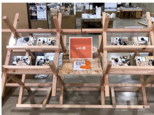
学生と話し合いを重ねて制作した什器

当初、学生が希望した什器は設計が複雑で、強度や費用等の問題もありました。しかし、当社の社員と学生の間で何度も話し合い、現実的な予算や制作手法を導き出して完成にたどり着くことができました。