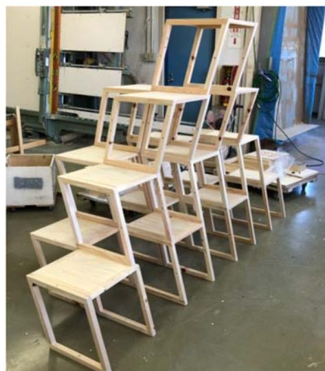
強度の問題をクリアし斜めの形にも組み立てが可能に