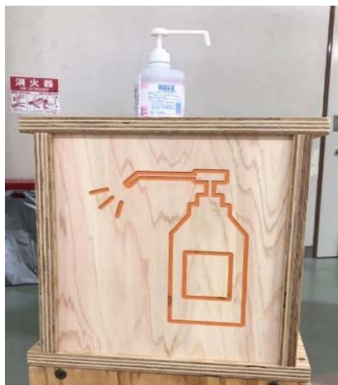
アルコール消毒液のサイン

来場者に検温とアルコール消毒への協力を促すサイン。遠くからでも消毒液の設置場所がすぐに分かるデザインにするなど、学生のアイデアが活かされています。