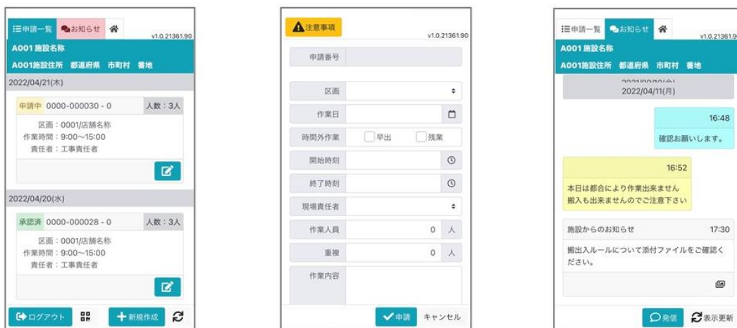
内装監理システムのスマートデバイス操作画面（イメージ）

本システムは、建設現場における作業届や搬入届など、これまで紙で行われてきた各種申請をデジタル化するものです。申請内容はクラウド上で一元的に管理されるため、関係者間で円滑に情報共有できるようになります。これら内装監理業務のデジタル化で、生産性向上と工事関係者らの作業負担軽減、ペーパーレス化による環境負荷低減を実現します。