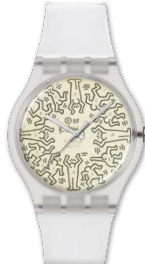
FROM THE ARCHIVE SO29Z145 FROM THE ARCHIVE PAY! SO29Z146-5300

ケース: 33 mm x 33mm、マットオレンジ BIOCERAMICケースとクラウン、SwatchのロゴをあしらったBIOCERAMIC丸型バッテリーカバー 文字盤: マルチカラープリント ガラス: エッジ・トゥ・エッジのバイオ由来素材 針: 矢印型、暗闇で光る効果のブラックの時針と分針、ブラックの秒針 ストラップ: マットブラックバイオ由来素材のストラップとループ、マットブラックのBIOCERAMICバックル 耐水性: 2気圧