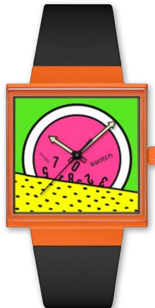
BREAK TIME SO34Z1O1

ケース: 33 mm x 33mm、マットブラック BIOCERAMICケースとクラウン、SwatchのロゴをあしらったBIOCERAMIC丸型バッテリーカバー 文字盤: ブラックとホワイトのプリント ガラス: エッジ・トゥ・エッジのバイオ由来素材 針: 矢印型、暗闇で光る効果のシルバーカラーの時針と分針、シルバーカラーの秒針 ストラップ: マットブラックバイオ由来素材のストラップとループ、マットブラックのBIOCERAMICバックル 耐水性: 2気圧