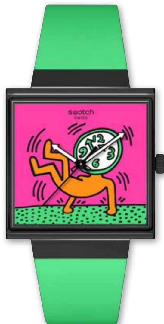
BREAKS OFF SO34Z1O2

ケース: 33 mm x 33mm、マットブラック BIOCERAMICケースとクラウン、SwatchのロゴをあしらったBIOCERAMIC丸型バッテリーカバー 文字盤: マルチカラープリント ガラス: エッジ・トゥ・エッジのバイオ由来素材 針: 矢印型、暗闇で光る効果のブラックの時針と分針、ブラックの秒針 ストラップ: マットグリーンストラップ、マットブラックのループ、マットブラックのBIOCERAMICバックル 耐水性: 2気圧