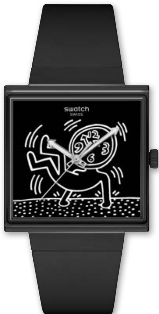
BREAK LOOSE SO34Z1O3

ケース: 33 mm x 33mm、マットブラック BIOCERAMICケースとクラウン、SwatchのロゴをあしらったBIOCERAMIC丸型バッテリーカバー 文字盤: マルチカラープリント ガラス: エッジ・トゥ・エッジのバイオ由来素材 針: 矢印型、暗闇で光る効果のブラックの時針と分針、ブラックの秒針 ストラップ: マットグリーンストラップ、マットブラックのループ、マットブラックのBIOCERAMICバックル 耐水性: 2気圧