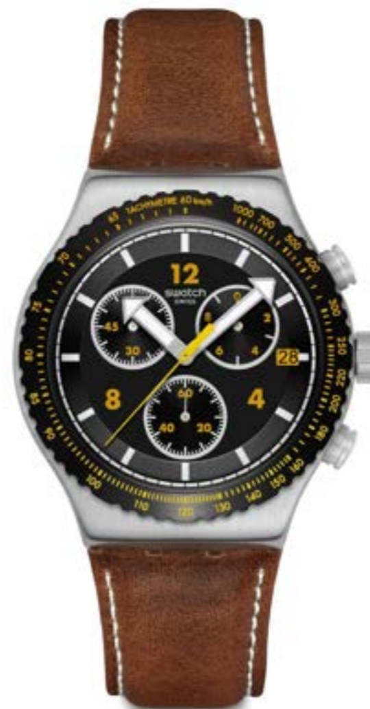
CANYON CHASER YVS530

ケース: 径 38mm、シャイニー仕上げのステンレススチールにブラックのPVDコーティング 文字盤: ブラック、サンレイ仕上げ、ダークブルーのプリントリング、グレーのプリントインデックス 針: 暗闇で光るブラックの時針および分針 ストラップ: マットダークブルー(裏面はグレー)、マットダークブルーのループ、シャイニー仕上げのステンレススチール製バックルにブラックのPVDコーティング ムーブメント: クォーツ 防水性: 3気圧