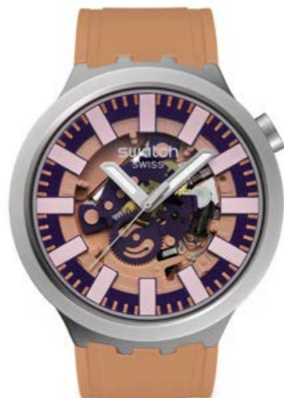
TERRACOTTA TIDE SBO7S119

ケース: 径 47mm、サンドブラスト仕上げのステンレススチール ベゼル: サンドブラスト仕上げのステンレススチール 文字盤: グレーとグリーンのプリントを施したブラックのオープンダイヤル 針: 暗闇で光るグリーンの時針および分針、グレーの秒針 ストラップ: マットダークグリーン、マットグリーンとブラックのループ、サンドブラスト仕上げのステンレススチール製ハーフバックル ムーブメント: クォーツ 防水性: 3気圧