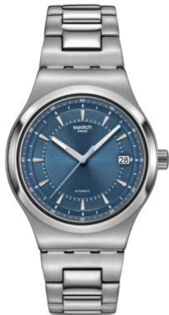
SHIMMER AT DUSK YIS435G

ケース: 42mm、サンレイ仕上げのステンレススチール ベゼル: シャイニー仕上げのステンレススチール 文字盤: ブルーにサンレイ仕上げ、シルバーカラーのインデックス、ライトブルーのプリント 針: 暗闇で光るシルバーカラーの時針および分針、ライトブルーの秒針 ブレスレット: ポリッシュド&サンレイ仕上げのステンレススチールにバタフライバックル ムーブメント: SISTEM51 防水性: 3気圧