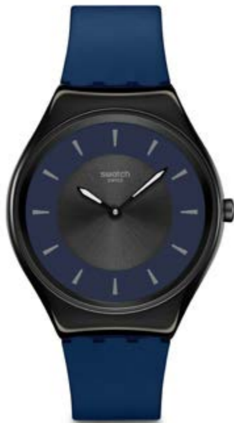
DUET AT DUSK SYXB108

ケース: 径 38mm、シャイニー仕上げのステンレススチール 文字盤: ライトブラウン、サンレイ仕上げ、ベージュのプリントリング、ダークブラウンのプリントインデックス 針: 暗闇で光るブラックの時針および分針 ストラップ: マットダークブラウン(裏面はベージュ)、マットダークブラウンのループ、シャイニー仕上げのステンレススチール製バックル ムーブメント: クォーツ 防水性: 3気圧