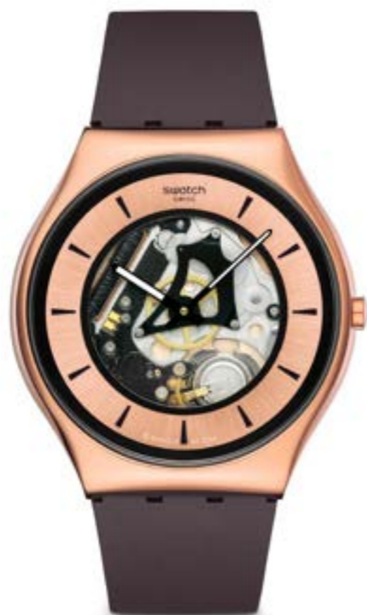
COPPER FLAME SSO7G107

ケース: 42mm、サンレイ仕上げのステンレススチール ベゼル: シャイニー仕上げのステンレススチール 文字盤: ブルーにサンレイ仕上げ、シルバーカラーのインデックス、ライトブルーのプリント 針: 暗闇で光るシルバーカラーの時針および分針、ライトブルーの秒針 ブレスレット: ポリッシュド&サンレイ仕上げのステンレススチールにバタフライバックル ムーブメント: SISTEM51 防水性: 3気圧