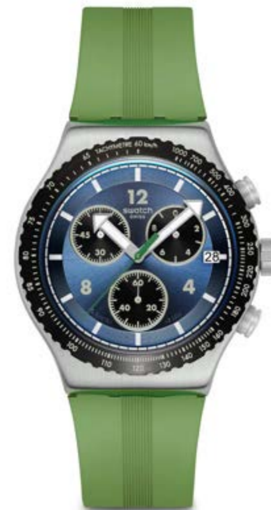
DUSK THRU THE LEAVES YVS531

ケース: 径 43mm、サンレイ仕上げのステンレススチール ベゼル: サンレイ仕上げのステンレススチールにブラックのPVDコーティングとオレンジのプリント 文字盤: ブラックにホワイトとオレンジのプリント、暗闇で光るホワイトのプリントインデックス、3時位置に日付表示窓 針: 暗闇で光るシルバーカラーの矢印型の時針および分針、イエローのクロノグラフ秒針 ストラップ: ブラウンのレザーにホワイトのステッチ、ブラウンのレザーのループ、サテン仕上げのステンレススチール製ハーフバックル ムーブメント: クォーツ 防水性: 3気圧