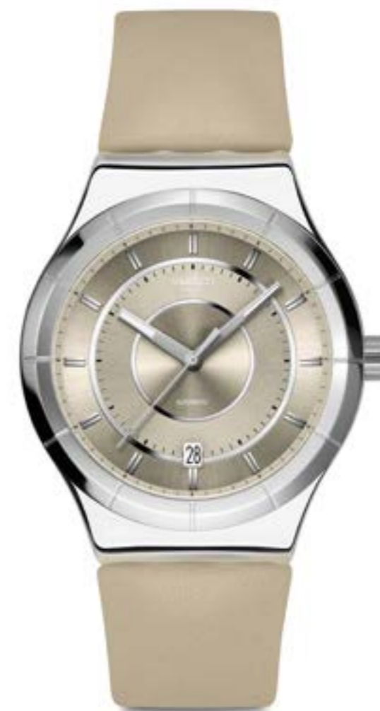
MOCHA DREAM YIS434

ケース: 径 47mm、サンドブラスト仕上げのステンレススチール ベゼル: サンドブラスト仕上げのステンレススチール 文字盤: ダークパープルとダークピンクのプリントを施したシルバーカラーのオープンダイヤル 針: 暗闇で光るシルバーカラーの時針および分針、シルバーカラーの秒針 ストラップ: マットダークパープル、マットダークパープルとダークピンクのループ、サンドブラスト仕上げのステンレススチール製ハーフバックル ムーブメント: クォーツ 防水性: 3気圧