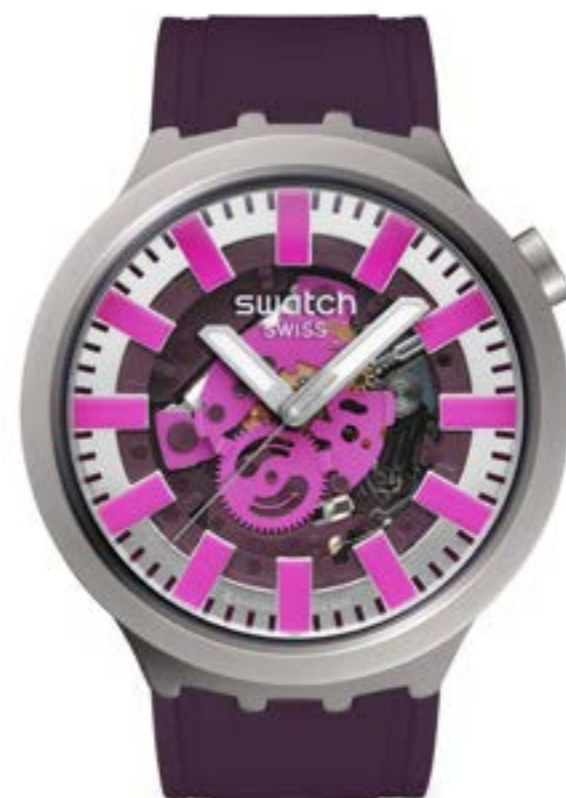
AUDACIOUS ACAI SBO7S120

ケース: 径 47mm、サンドブラスト仕上げのステンレススチール ベゼル: サンドブラスト仕上げのステンレススチール 文字盤: ベージュとライトピンクのプリントを施したダークパープルのオープンダイヤル 針: 暗闇で光るシルバーカラーの時針および分針、シルバーカラーの秒針 ストラップ: マットベージュ、マットベージュとライトピンクのループ、サンドブラスト仕上げのステンレススチール製ハーフバックル ムーブメント: クォーツ 防水性: 3気圧