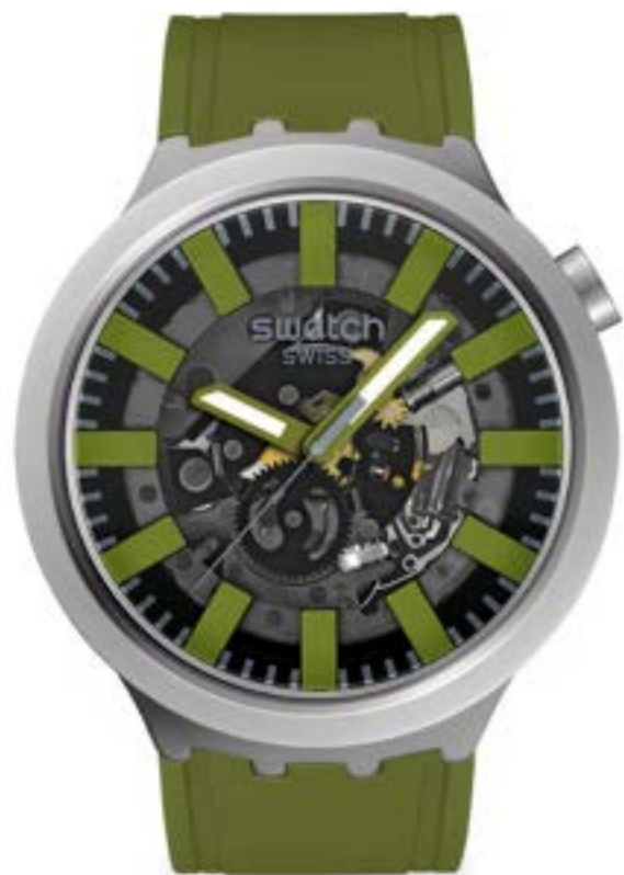
THRU THE UNDERBUSH SBO7S118

ケース: 径 47mm、サンドブラスト仕上げのステンレススチール ベゼル: サンドブラスト仕上げのステンレススチール 文字盤: グレーとグリーンのプリントを施したブラックのオープンダイヤル 針: 暗闇で光るグリーンの時針および分針、グレーの秒針 ストラップ: マットダークグリーン、マットグリーンとブラックのループ、サンドブラスト仕上げのステンレススチール製ハーフバックル ムーブメント: クォーツ 防水性: 3気圧