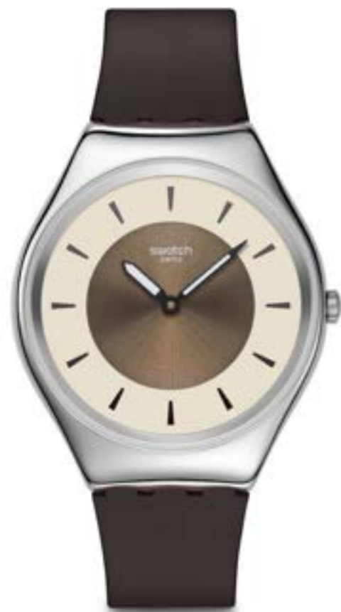
HAZEL DELIGHT SYXS158

ケース: 径 38mm、シャイニー仕上げのステンレススチール 文字盤: ライトブラウン、サンレイ仕上げ、ベージュのプリントリング、ダークブラウンのプリントインデックス 針: 暗闇で光るブラックの時針および分針 ストラップ: マットダークブラウン(裏面はベージュ)、マットダークブラウンのループ、シャイニー仕上げのステンレススチール製バックル ムーブメント: クォーツ 防水性: 3気圧