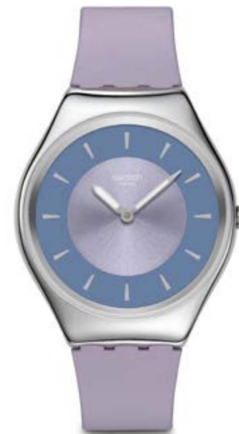
LYRICALLY LAVENDER SYXS157

ケース: 42mm、サンレイ仕上げのステンレススチール 文字盤: シルバーカラーのオープンダイヤル、サンレイ仕上げ、ブラックのプリントインデックス、トープカラーのリング 針: 暗闇で光るブラックの時針および分針 ストラップ: マットトープカラー、マットトープカラーのループ、サンレイ仕上げのステンレススチール製バックル ムーブメント: クォーツ 防水性: 3気圧