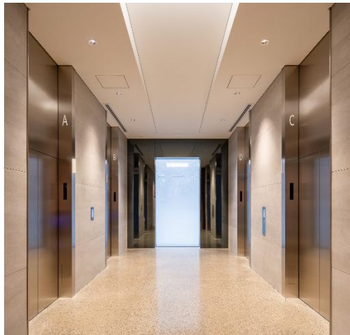
納入したエレベータ