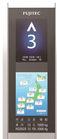
情報モニターの表示内容（イメージ図）