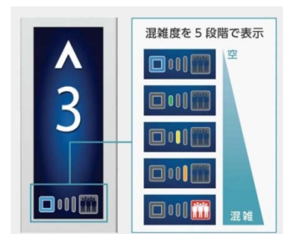
混雑度表示のイメージ